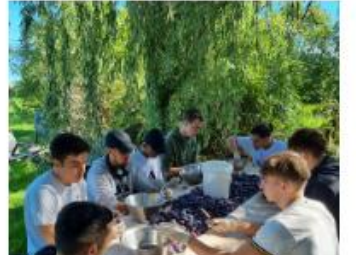
Biodiversität, Klimaschule, Nachhaltigkeit