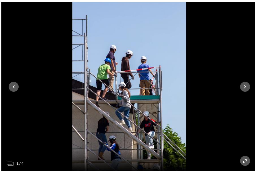
Die Gerüsttreppe hoch brauchte es Überwindung, aber der Ausblick auf die Anlage und aufs Zürcher Unterland hat sich gelohnt.

Auch die Schülerinnen und Schüler, die nicht zum Montageteam gehörten, mussten nicht am Boden bleiben. Alle durften unter Begleitung der EKZ-Experten aufs Dach steigen und miterleben, wie die Solaranlage entsteht. Ergänzend zum Bau durchliefen alle Klassen einen Workshop, um so Leistung und Funktion der neuen Errungenschaft kennen zu lernen.