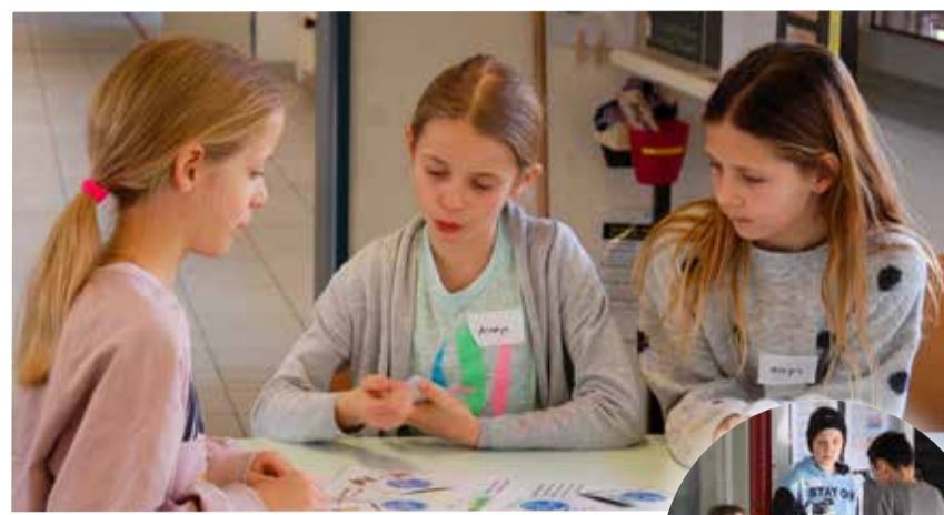
▲ Konzentrierte Schülerinnen am Posten «Energie».

Ein Fangis der besonderen Art: Die Kinder schlüpfen in die Rolle von Tieren und Lebensräumen und erlernen spielerisch die Wichtigkeit des Themas Biodiversität. ▶