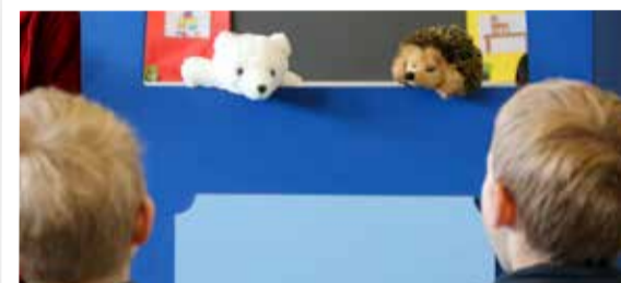
Im Kindergarten kommen der Eisbär und der Igel auf die Bühne, um ihre Sorgen über eine wärmer werdende Umwelt mitzuteilen.