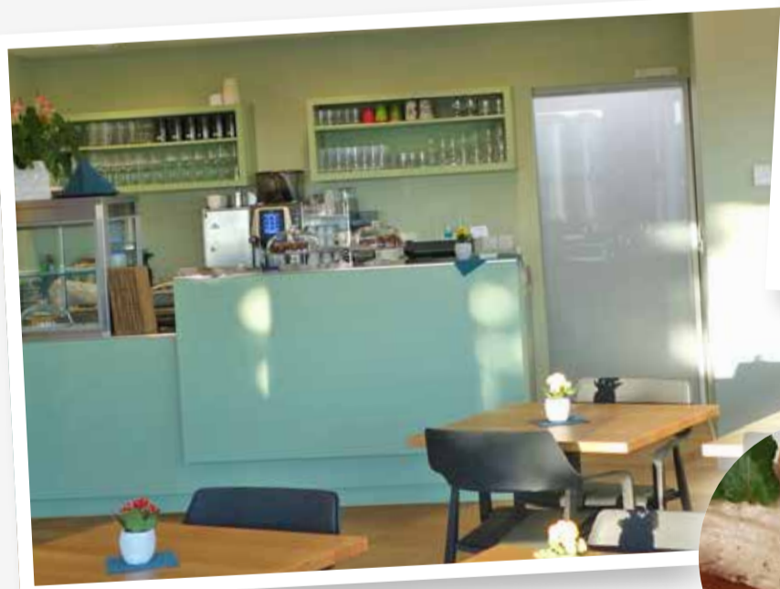
Willkommen im Bistro im Spilhöfler.