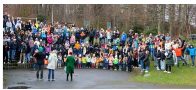
Vom Kindergarten bis hin zur Oberstufe – alle hören gespannt zu.