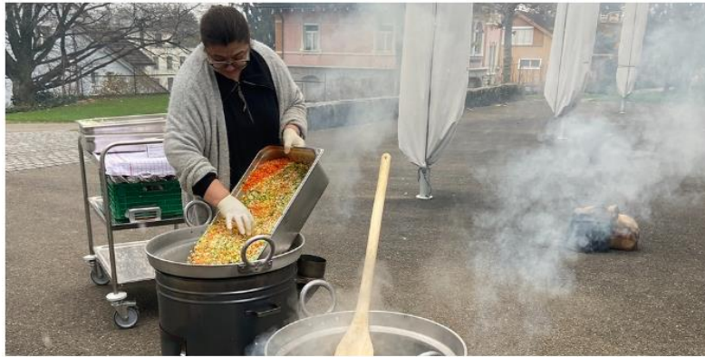
Die Zutaten der Gerstensuppe konnten in die mit Holz vorgeheizten Kessel gegeben werden.