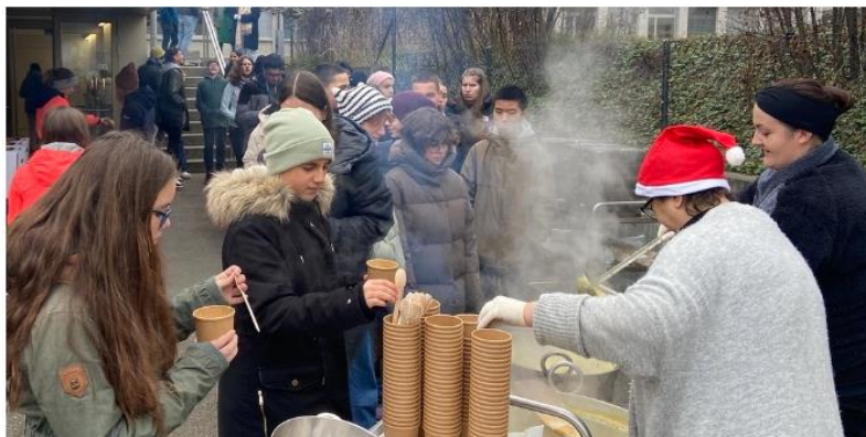
Es gibt nichts Besseres bei diesem kalten Wetter als eine heisse, köstliche Suppe.