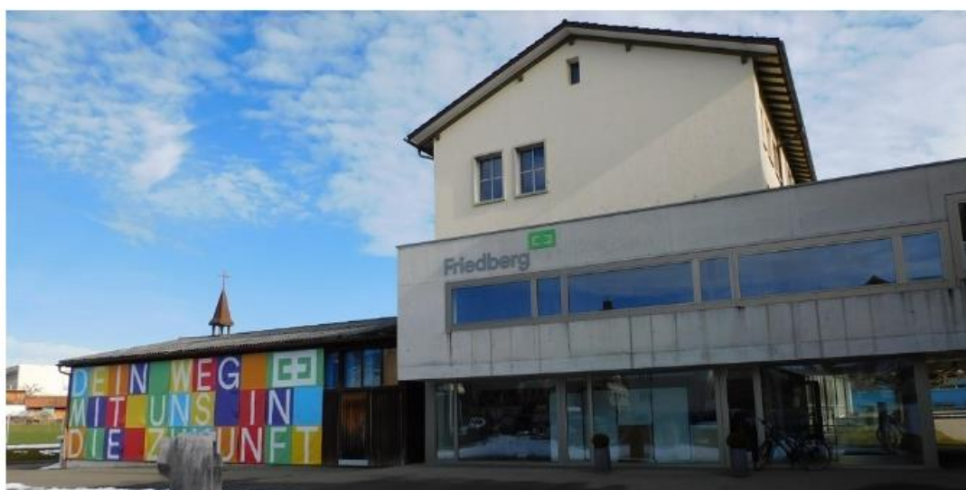
Gymnasium Friedberg in Gossau.

Mit dem Blackout Day ist die Kampagne «Jede Schule zählt – Klimaschutz macht Schule!» eröffnet. Das Ziel der Kampagne ist, möglichst viele Personen aus dem Schulumfeld für den Klimaschutz zu begeistern und das Gymnasium Friedberg in seinen nachhaltigen Aktivitäten zu unterstützen. Mehr zur Community und zur Newsletter-Anmeldung unter klimaschule.ch/friedberg .