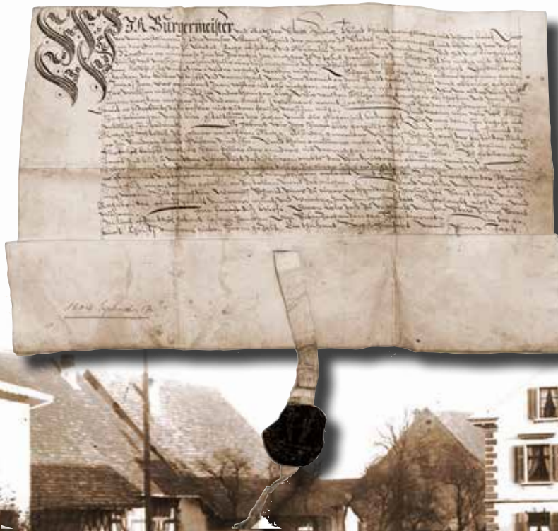
Tavernenrecht zur Rose, 1604