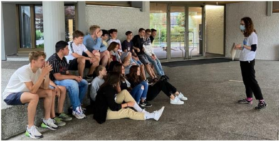
Ergänzend zur Installation auf dem Schulhausdach wurden am "Impact Day Solarenergie" an verschiedenen Posten Workshops zum Thema Energie angeboten.