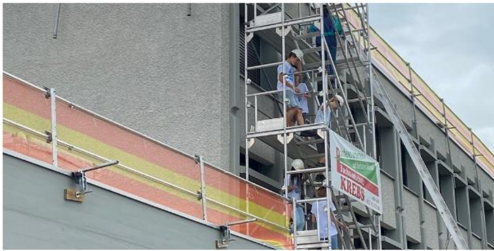
Die Schüler erhielten eine Sicherheitseinführung und wurden mit einem Helm versorgt, bevor sie aufs Dach durften.