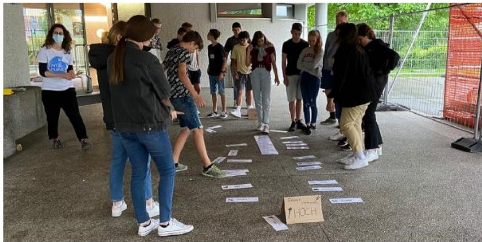
Nach dem Energiesprint, bei welchem die Schülerinnen und Schüler den Energieverbrauch für diverse Geräte und Aktivitäten einschätzen mussten, gab es eine rege Diskussion.