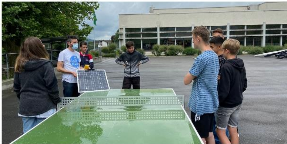
Was macht die unterschiedliche Lage zur Sonneneinstrahlung aus auf die Effizienz der Solarzellen?