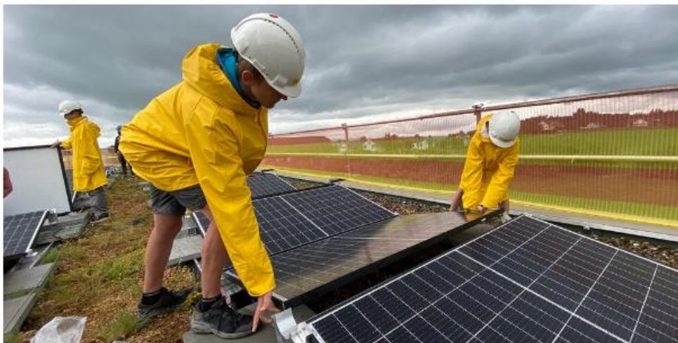
Professionelle Arbeit dank Instruktion durch die Profis.