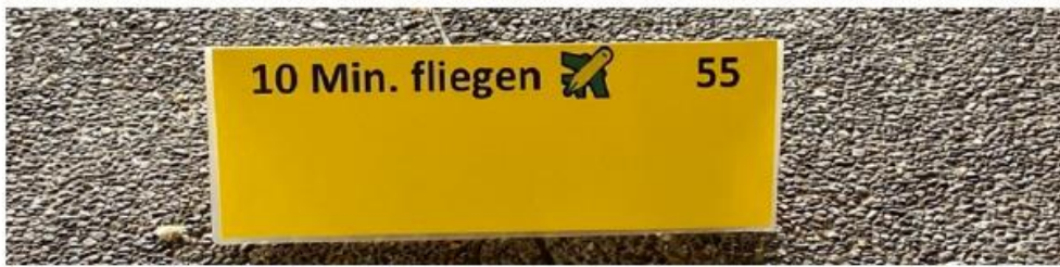
Das Vergleichen von unterschiedlich hohem Energieverbrauch regte zum Nachdenken an.