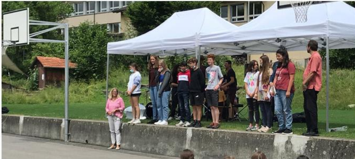
Das "Klimateam" bei der Zertifikatsfeier

Mit Doppelklick auf die Audiodatei gelangen Sie an die zwei Beiträge.