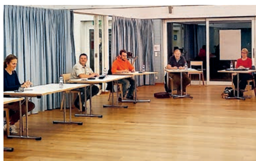
Konferenz der Vereinspräsidenten.

Diese Konferenz der Vereinspräsidenten ist eine regelmässige Plattform zum Gedankenaustausch und findet zweimal pro Jahr statt. In der Regel ist jemand von der Gemeinde anwesend, dadurch können gewisse Anliegen direkt besprochen werden. Bei einer kleinen Runde von acht Personen wurden diesmal die von den Vereinen zugestellten Daten im Veranstaltungskalender redigiert, der zweimal pro Jahr in alle Haushalte verteilt wird. Trotz der kleinen Gruppe ergab sich ein interessanter Austausch.