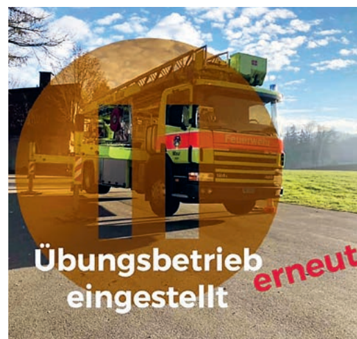
Die Feuerwehr stellte wegen Covid ihre Übungen ein.