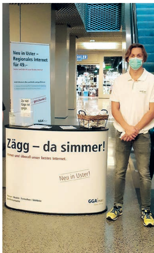
Zägg, da ist sie, die GGA Maur.

Ab dem 5. Oktober können auch Ustermer Haushalte die Dienstleistungen des Telecom-Anbieters aus Binz in Anspruch nehmen. Die GGA Maur macht mit Aktionswochen in Uster auf ihr Angebot aufmerksam und richtet temporär einen Stand im Zentrum Illuster ein.