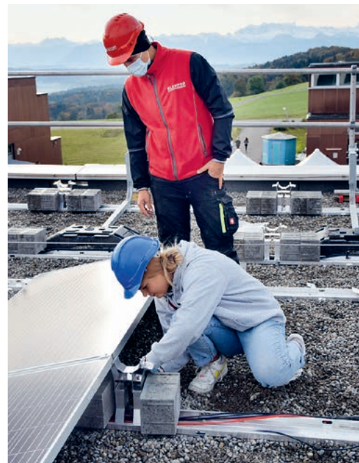
Schüler montierten Solarpanels auf dem Dach des neuen Schulhauses Nord.

Immer noch aktuell ist übrigens die Looren-Aktion «Jede Zelle zählt». Von den 510 zur Verfüg-