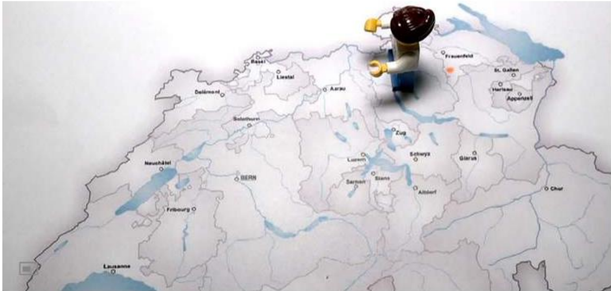
Thurgauer Schulkinder rennen fürs Klima bis nach Bern.

Am Donnerstagnachmittag sind 100 Schülerinnen und Schüler der Sekundarschule Lützelburg TG in einen Stafettenlauf gestartet. Sie rennen innerhalb von einem Tag von ihrem Schulhaus in Bichelsee-Balterswil bis auf den Bundesplatz in Bern.